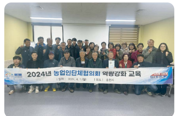
경기도 이천시 농업인 단체 방문

3.21(목) 춘천시농업기술센터 대회의실에서 제2대 회장 선거가 있었습니다. 대의원과 이사로 구성된 120명의 선거인단의 투표로 치러진 이번 선거는 116명이 참여 97%의 높은 투표율을 보였습니다.