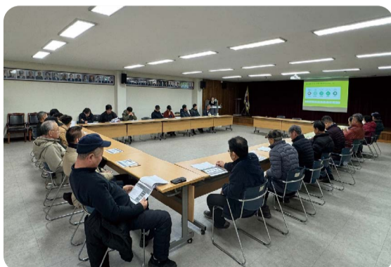
읍면 순회 간담회 개최

2.6(화) 춘천시농업기술센터 대회의실에서 제1차 대의원 총회가 개최되었습니다. 총회에서는 23년도 활동보고 및 회계감사 보고, 이사변경 보고, 24년 사업 계획 승인, 정관 일부 개정 승인 등의 안건을 심의·의결 하였습니다.